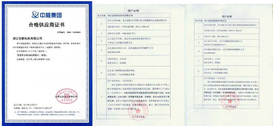
图 3 客户认可示例